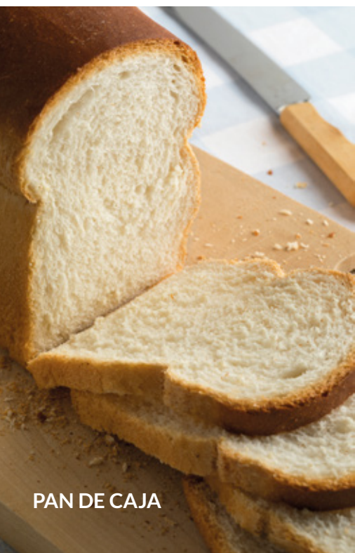
PAN DE CAJA

Con base en almidón de maíz, FAR-XTEND-P es un conservador natural que ofrece beneficios como ningún otro en el mercado, alarga la vida en anaquel y potencia el sabor en productos de panadería, aderezos para ensaladas y quesos manteniendo una etiqueta limpia.